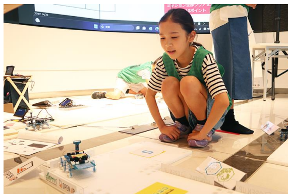
ロボット製作・プログラミング学習の様子

「こどもテックキャラバン」とは、広島県内の自然豊かな複数会場を家族で旅団のように移動しながら、ロボット製作・プログラミングの学習や自然学習を通じて、子どもたちが新たな関心事や可能性を広げることを応援するイベントです。企業サポーターはさまざまなワークショップを実施し、モノづくりの楽しさ、心湧き立つ体験の機会を提供します。