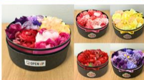
丸形ボックス型アレンジ