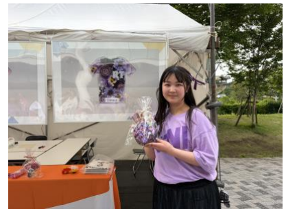
当選者の喜びの様子

株式会社オープンアップウイズは、障害のあるスタッフによるオープンアップグループ各社の事務受託やフラワーアレンジメント制作、古紙を再利用した紙漉きによる紙製品の製作などの事業を展開する特例子会社です。