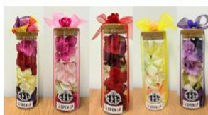
ボトル型アレンジ