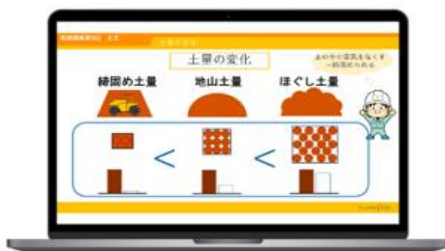
受験対策講座のeラーニング