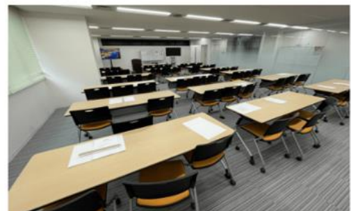
試験前の自習室開放